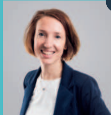
1 Susen Katter

40 Jahre | Verheiratet | 2 Kinder | Bürgermeisterin der Stadt Stockach